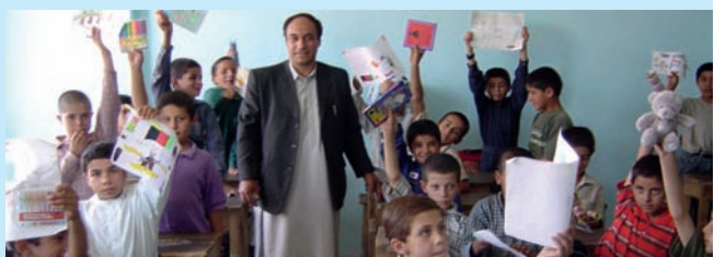
Kinderen van Afgaanse school krijgen tekeningen uit Nederland

Wie meer wil weten kan terecht op de website van de Stichting SCAN: www.StichtingSCAN.com .