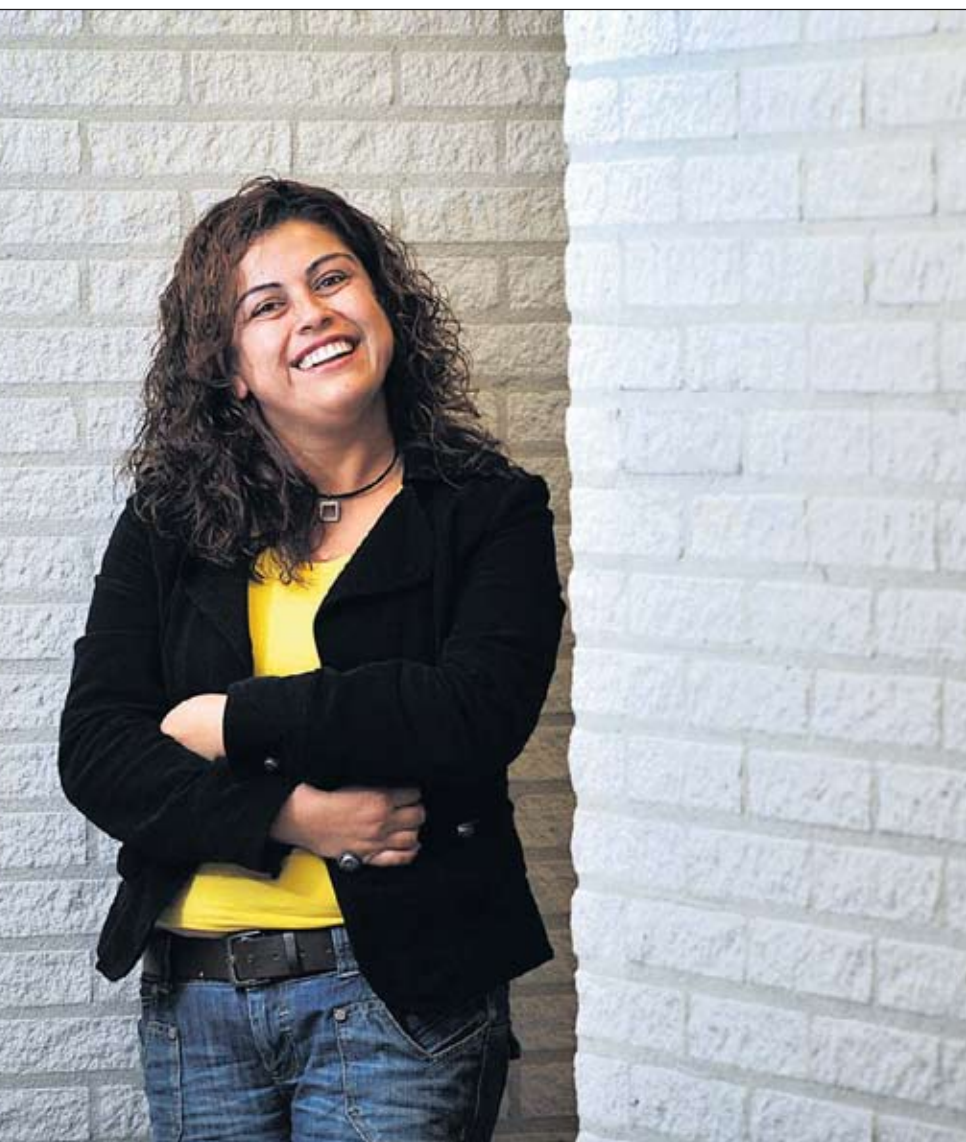
als verzorgende kan helpen.

vertellen wat dat is, een hospice, dat mensen goed verzorgd worden in een verzorgingshuis en dat er zoiets als thuiszorg bestaat. Omdat de eerste generaties Marokkanen en Turken ook 'op leeftijd' komen, zullen ook zij steeds meer zorg nodig hebben. Daarom is het een goede zaak, vindt Proteion Thuis, dat er in de regio Venlo een veertigtal vrouwen is dat in de eigen taal kan uitleggen welke moge-